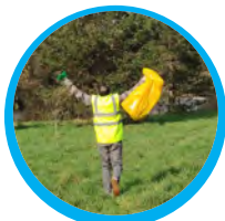
Happy tri !

Il relaie les informations sur le tri et la réduction des déchets.